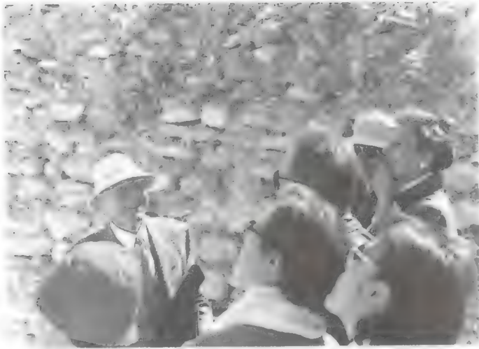
لویر مرشدأ سیاحیا